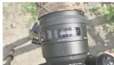
PRÉ-RÉGLAGE À 11/12 MÈTRES 00:00:15

La rapidité de l'autofocus va toutefois dépendre de la qualité de vos objectifs.