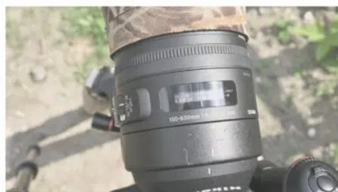
PRÉ-RÉGLAGE À L'INFINI 00:00:25